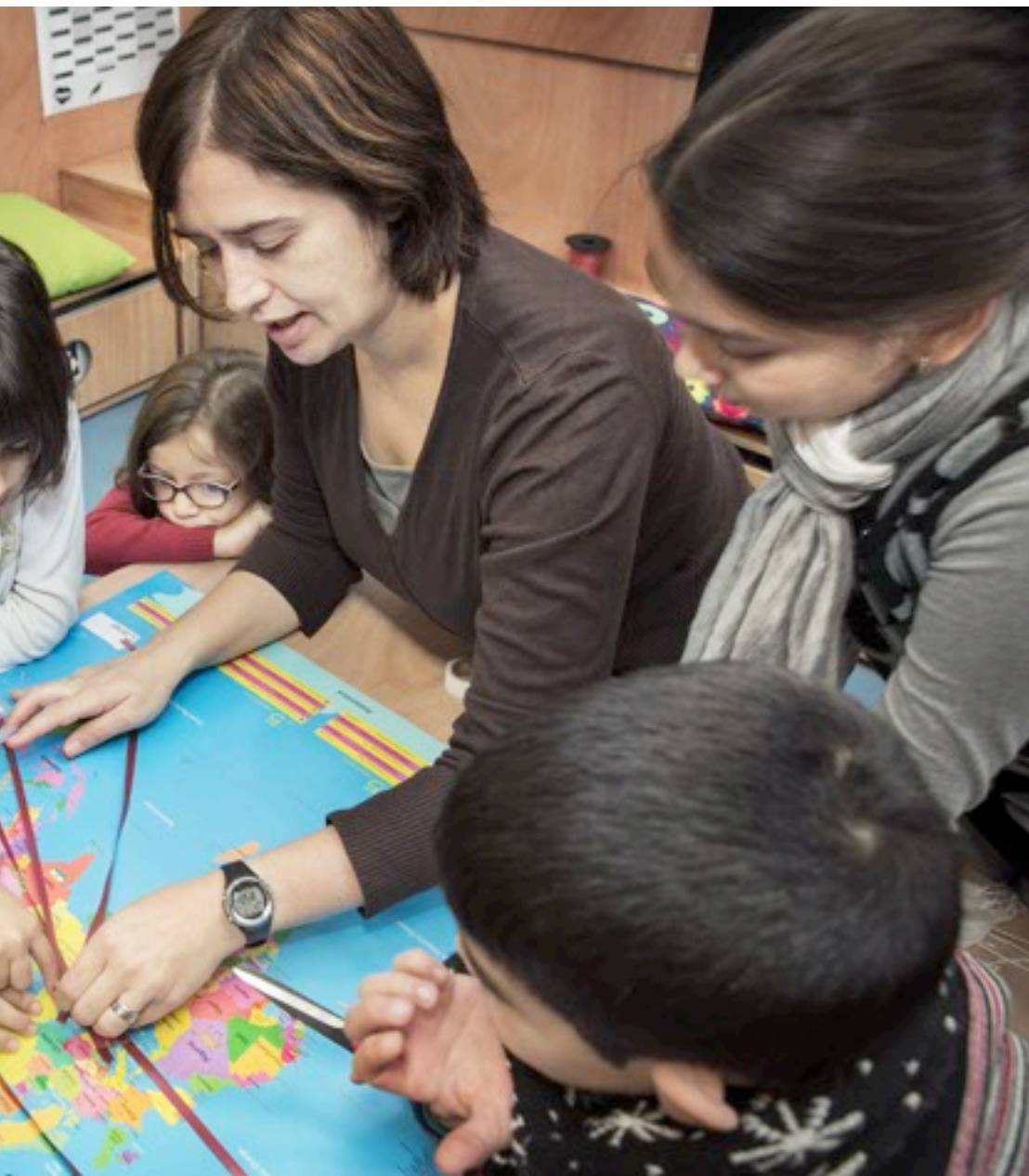
in haar klas in Schaarbeek.

Op 15 november gaat in de KVS in Brussel de 31ste editie van 'Geletterde Mensen' van start, deze keer met schrijver en acteur Josse De Pauw en de Nederlandse gitariste en componiste Corrie van Binsbergen . Josse De Pauw werkt aan de opvolger van zijn bekroonde boeken Werk en Nog . Hij put voor deze voorstelling uit deze boeken, maar brengt ook teksten die nog niet eerder publiekelijk te horen waren. Daarnaast presenteert hij fragmenten die in het voorjaar van 2014 in zijn nieuwe boek zullen verschijnen. Met Van Binsbergen maakte De Pauw in 2010 de opera Over de bergen . De tournee sluit in Amsterdam af op 4 december. www.begeerte.be