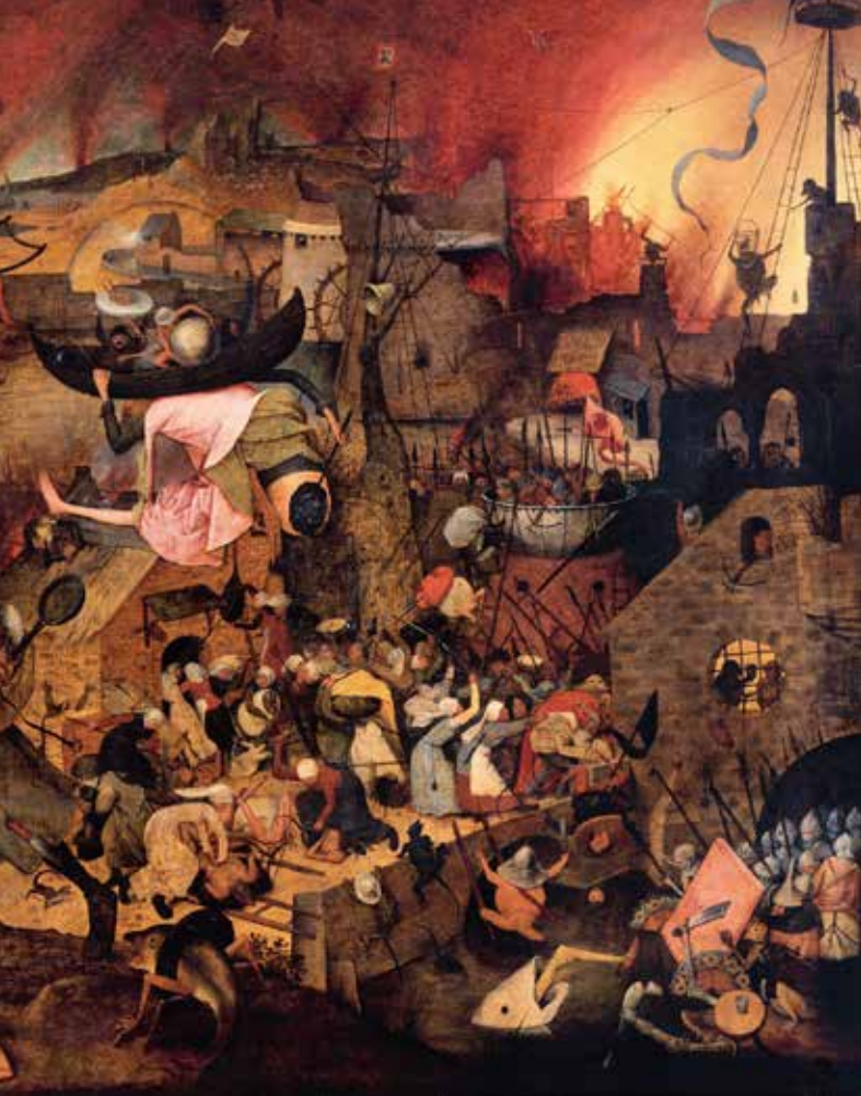
Dulle Griet (1563), Museum Mayer van den Bergh