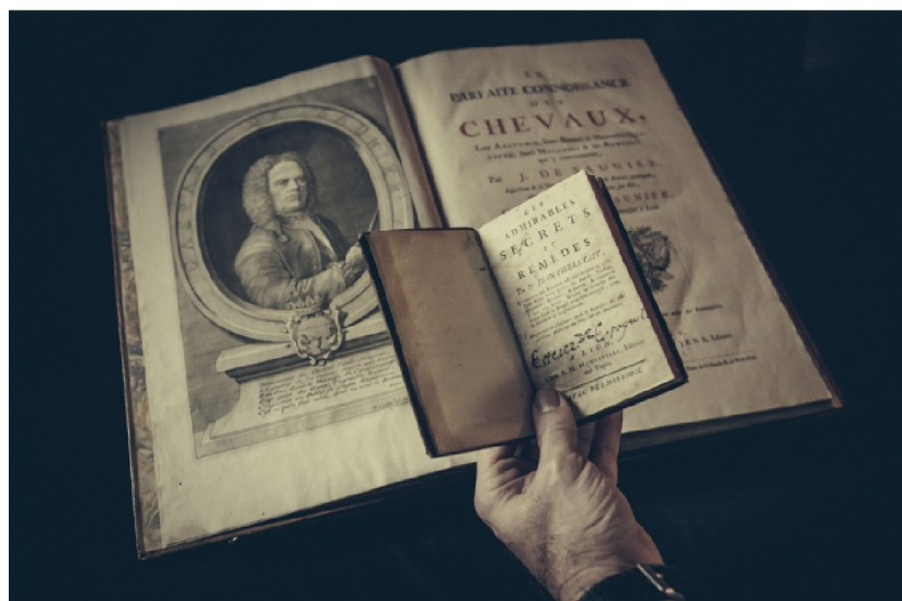
Het paard kreeg lang buitenproportioneel veel aandacht en dat was ook te merken aan de boeken die erover verschenen. ‘Ze waren wat auto’s nu zijn.’

‘In de 18de eeuw werden vreemde voorwerpen in paarden ingenaaid, omdat die alle etter zouden aantrekken, waarna je de “ziekte” kon uitdrijven. Die detox-geest waart vandaag nog rond’